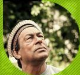
Ailton Krenak Socioativista